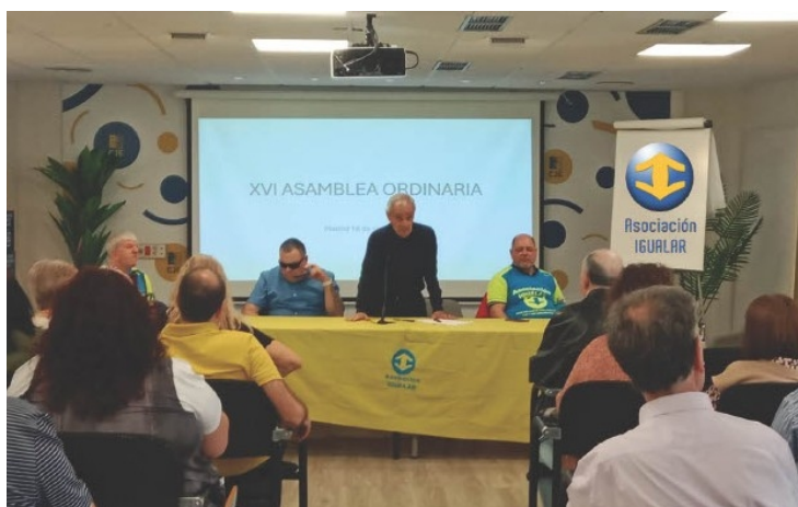
FOTOGRAFÍA DE PARTE DE LA JUNTA DIRECTIVA DE LA ASOCIACIÓN IGUALAR.