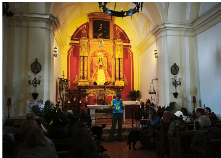
FOTOGRAFÍA DEL LOS PARTICIPANTES SENTADOS EN LOS BANCOS DE LA ERMITA NUESTRA SEÑORA DE LA MISERICORDIA.

A menos de una hora de Madrid, la histórica villa de Chinchón aguarda a los visitantes para una jornada de inmersión cultural incomparable. El recorrido comienza con un trayecto en autobús privado y una visita guiada por su emblemático casco antiguo, donde destaca la majestuosidad de su famosa Plaza Mayor. Tras explorar su rico patrimonio, la experiencia continúa con un almuerzo tradicional en el restaurante “El Jardín de la Condesa”, el escenario perfecto para deleitarse con la gastronomía local. La tarde ofrece un matiz espiritual y arquitectónico con la visita al Convento de las Clarisas. Esta cuidada excursión representa la oportunidad ideal para vivir la esencia más auténtica de uno de los pueblos más bellos de España en un solo día de ocio y cultura.