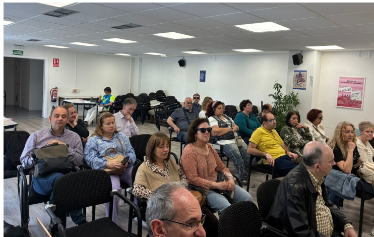
FOTOGRAFÍA DEL PÚBLICO ATENTO A LAS EXPLICACIONES DE LA ASOCIACIÓN IGUALAR.