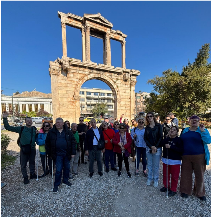
FOTOGRAFÍA DEL GRUPO CON EL ARCO ADRIANO DE FONDO EN GRECIA.

- VIAJE CRUCERO POR EL ADRIÁTICO, DEL VIERNES 27 DE MARZO AL LUNES 6 DE ABRIL.