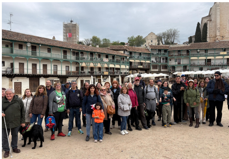
FOTOGRAFÍA DEL GRUPO EN LA PLAZA DE CHINCHÓN.